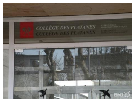
Collège des Platanes

Frauen Fussball national, Judo, Karate, Kunstturnen, RG, Leichtathletik, etc.